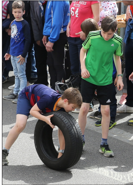
Geschicklichkeit im Umgang mit Ei und Pneu, dies bewiesen diese beiden.