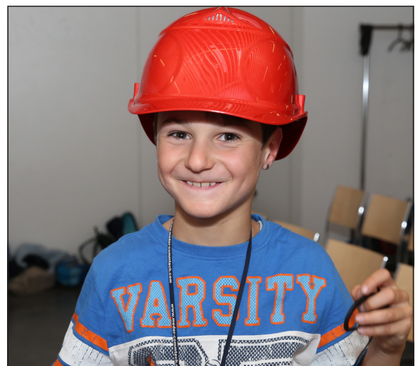
Mehrere Gruppen besuchen die Kehrichtverbrennungsanlage der IWB in Basel, ausgerüstet mit Helm, Empfangsgerät und Kopfhörer gingen die Kinder auf eine Tour durch die Anlage – das Highlight: einmal in den «Schlund» der Verbrennungsanlage blicken ... faszinierend.