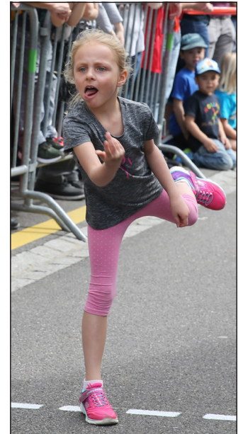
Beim Balancieren, Rennen, Werfen, Zielen oder Fangen, die Kids aus Schönenbuch waren in diesem Jahr eine Klasse für sich ...