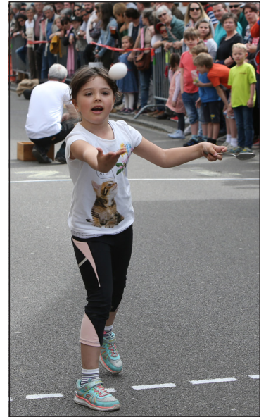
Viel Feingefühl und die richtige Handhaltung haben zum Sieg geführt.