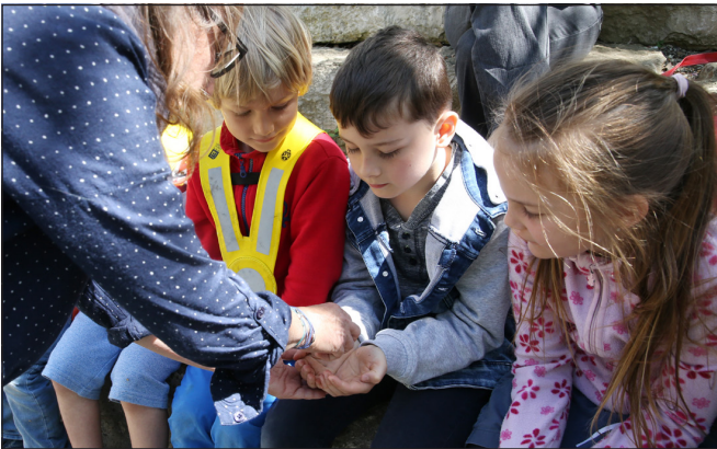
Wer hilft unsere Gartenabfälle in Nährstoff für den Garten umzuwandeln?