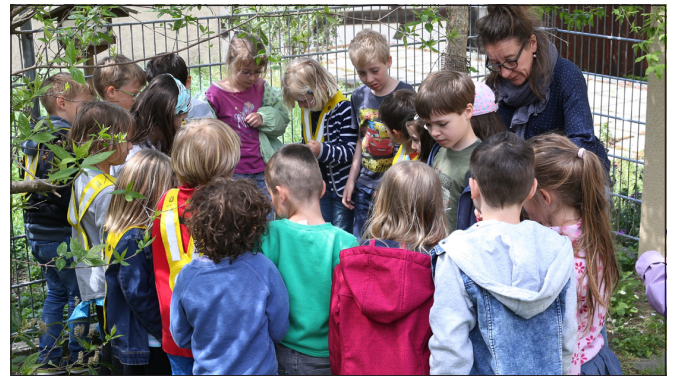
Ein Schulkompost wurde angelegt.