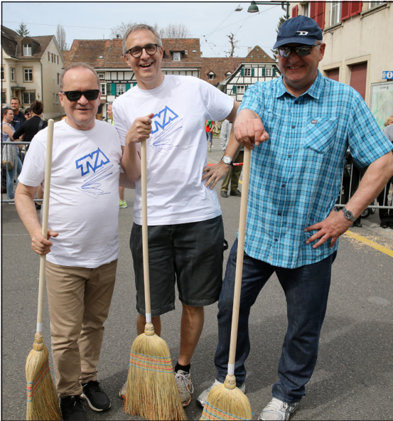
Sie hatten im «Fangraum» alles im Griff und sorgten für das Nachfüllen der Körbe mit Spreu.