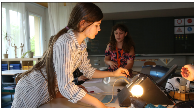
Ob durch Zuhören oder selber testen, während der Projektwoche konnten die Kinder viel über Energieverbrauch und Entsorgung lernen.