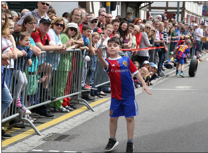
Volle Konzentration erforderte das technisch richtige Werfen ...

Zum ersten Mal fand das Eierlesen vor neuer Kulisse statt: von der Neuweilerstrasse ist man in diesem Jahr an die Oberwilerstrasse umgezogen. Bei, wie gewohnt, wunderschönem Wetter und frühlingshaften Temperaturen starteten am 8. April die Pfadi Allschwil, der FC Allschwil und der TSV Schönenbuch für die Kategorie Jugend. In der direkten Begegnung gegen die Pfadi erwiesen sich die unsrigen vor allem im Löffelbalancieren als geschickter und holten dafür einen deutlichen Sieg. Obwohl bei der «älteren» Kategorie dann plötzlich die jüngeren Geschwister auf der Rennpiste aufliefen, gab es auch im zweiten Lauf gegen die Pfadi und die Junioren des FC Allschwil keinen Zweifel daran, wer in diesem Jahr die Nase beim Eierwerfen, -fangen und -balancieren vorn hatte.