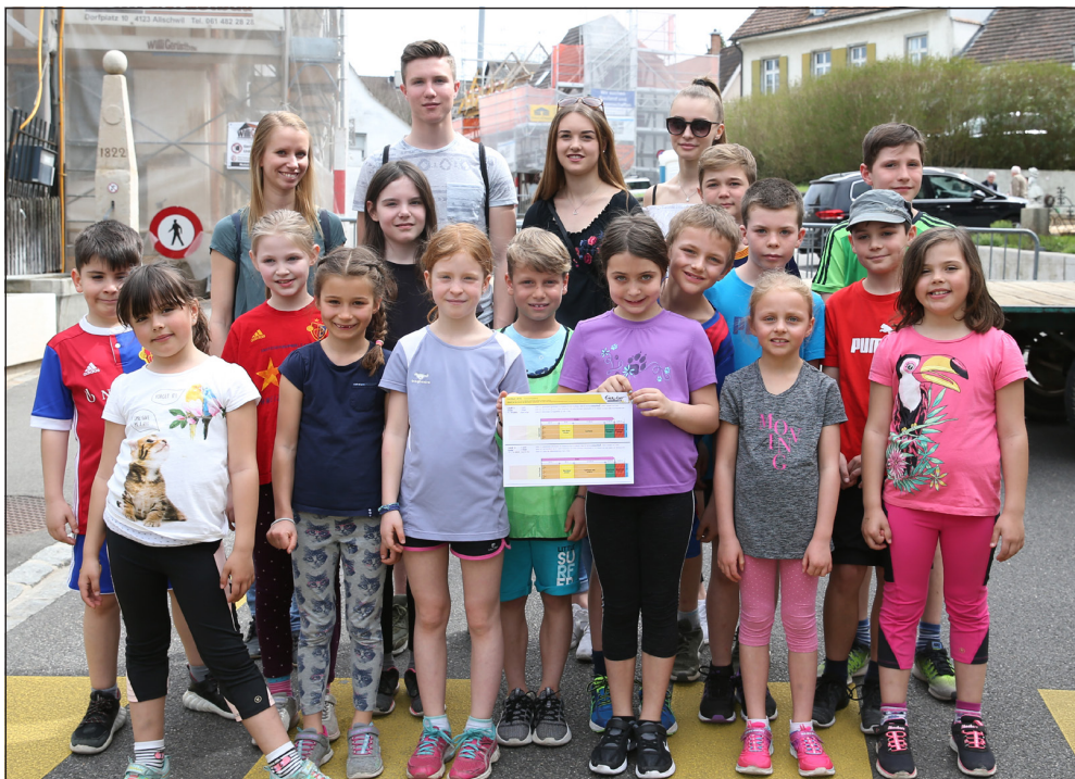
Doppelsieg für die Mädchen und Jungs von der Mädchen- und Bubenriege des TSV Schönenbuch mit ihren Riegenleiterinnen und -leitern.