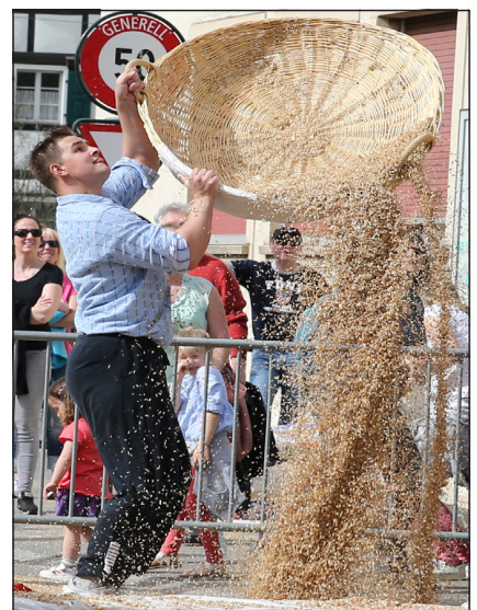
Weitere Schönenbacher Läufer, Werfer und Wanniers waren beim BC Smash und dem Plausch zu finden. Und im Schwingclub hiess die Devise «Schwingen» geht immer, ob den Gegner oder den Korb beim Eierlesen – das Ei landete zwar im Korb, leider war kein Spreu mehr drin.