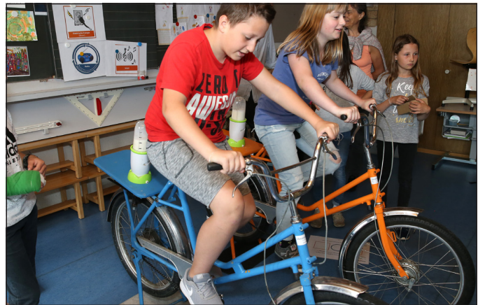
Mit Muskelkraft selber Energie erzeugen und durch Strampeln einen Mixer in Bewegung setzen, um einen Milchshake zu erhalten, die Kinder waren mit grossem Eifer bei der Sache.