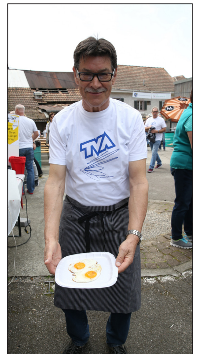
Die Helfer des TVA und FCA sorgen neben der Strecke für das leibliche Wohl.