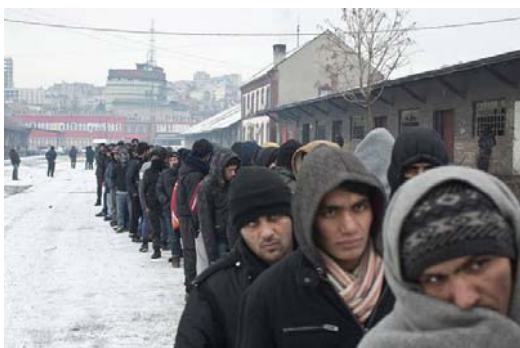
Griechenland und Balkan