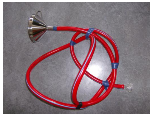
Foto: Jedes Kind bastelt sich im Kurs seine eigene Schlauchtrompete